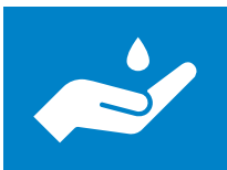
Higiene de manos