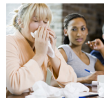
Exposicion a agentes infecciosos en el aire