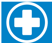
Limpiar y desinfectar