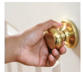
Contacto directo con una superficie contaminada